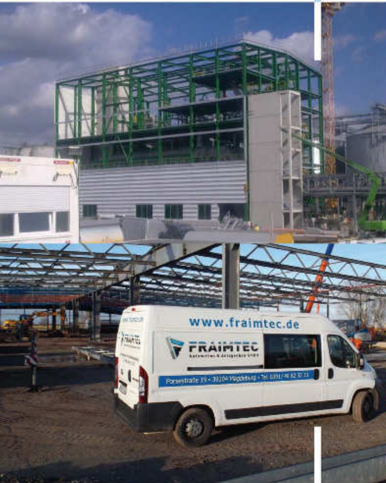
Montage Stahlbau Cargo-Zentrum Flughafen Cochstedt