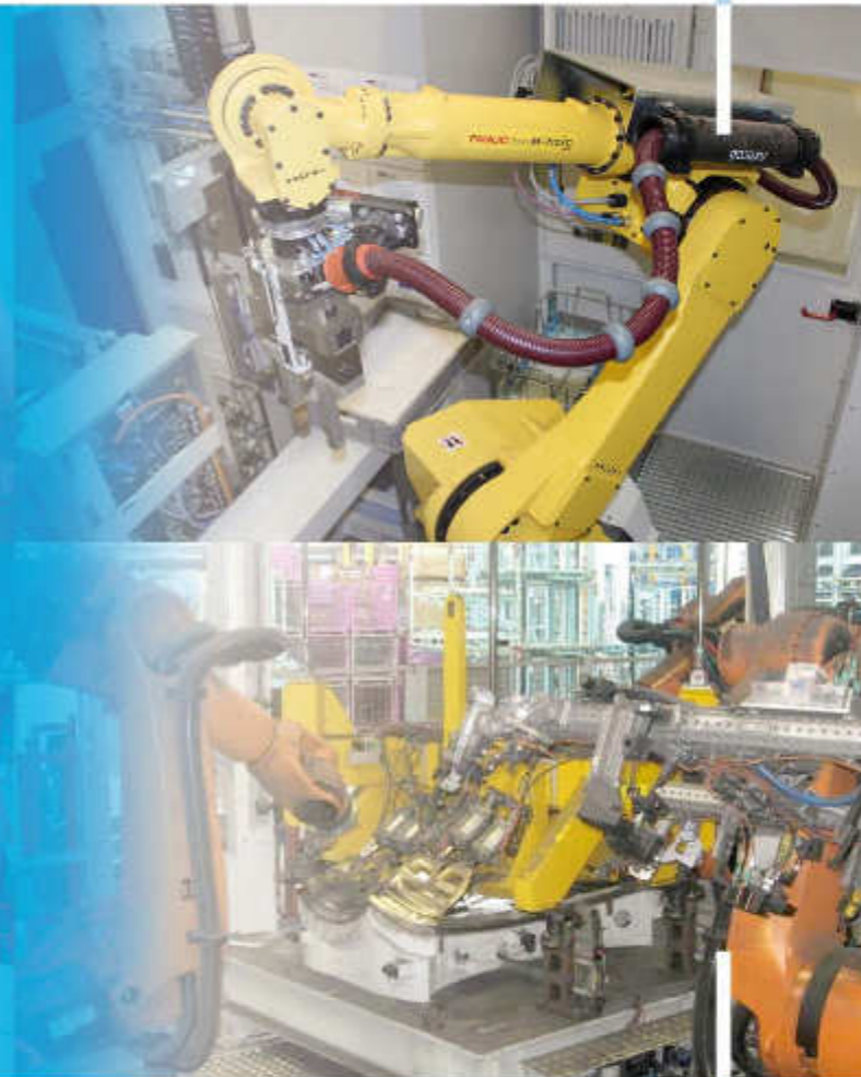
BMW Mini Plant Oxford